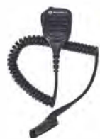
PMMN4067 IMPRES™ リモートスピーカーマイク