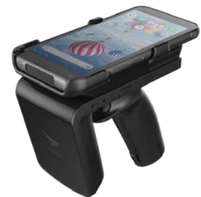
RFR901に搭載して高速、長距離読取

BluebirdのPower Manager™は、4,000mAhの大容量バッテリーをスマートに管理します。バッテリーは、通常、長時間の使用が求められますが、ホットスワップ機能により、ユーザはシステムを停止、シャットダウン、または再起動せずにバッテリーを交換でき、電池切れによるデータ損失のリスクを防ぐことができます。