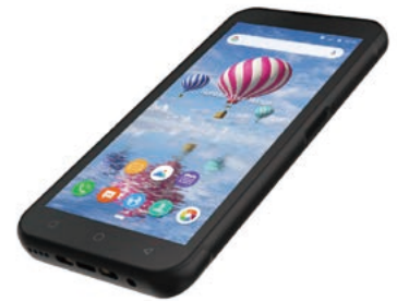
厚さ 14.9 mm のスリムボディ

最大300タグ/秒の高速読取と約40cmの近距離読取が可能なUHF帯RFIDリーダーを搭載していますので、入出荷、棚卸、商品管理、資産管理などの業務効率を最大化します。また、背面10ピンコネクタにより、RFIDリーダーRFR900 / RFR901に搭載して高速読取や長距離読取ができます。