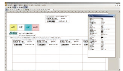
リストバンドデザイン画面