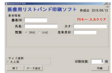
かんたんリストバンド入力画面