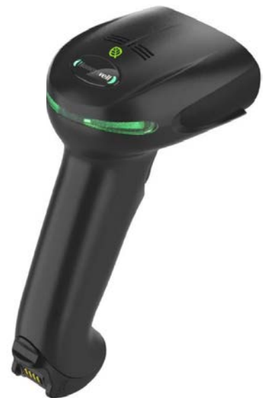
1952g-BF (上部エコマーク付)

XenonXP-1952g,1952g-BFは標準レンジSR、高密度HD の2機種を用意。用途に併せてお選び頂けます。