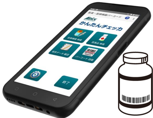
業務用モバイル端末 HF550X

かんたんチェッカは、業務用モバイル端末のバーコードリーダーを使い、医薬・医療機器用のバーコードが正しく作成されているかを簡単に確認することができるチェックツール。正しいバーコードを表示することで製品の取り違え事故防止やトレーサビリティの確保、流通の効率化などに寄与します。対応する業務用モバイル端末(HF550X)とアプリケーションをセットでご提供いたします。