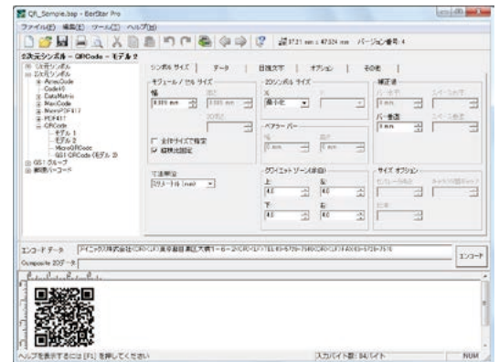
パラメータ設定画面

BarStar Proは、高精度でフレキシビリティの高いバーコード作成ソフトウェアです。プリンタの解像度情報を取得して、バーコードをプリンタ1ドット単位に自動調整して作成しますので、高精度なバーコードを印刷できます。また、印刷時にバーが太る場合や細る場合は、補正機能によりバー、スペースの微調整が可能ですので、より高精度な印刷が可能です。BarStar Proは、アプリケーション連携やアプリケーション組込が可能ですので、ラベル、伝票、振込用紙、送付案内、パッキングリスト、IDカード、電子チケットなど、様々なバーコードアプリケーションにご利用頂けます。